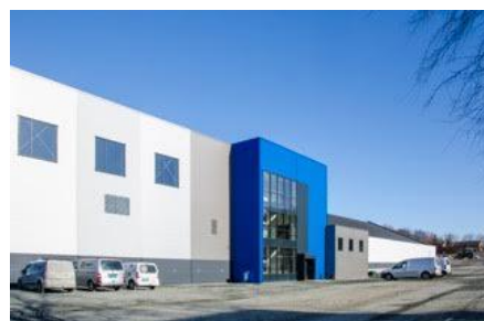
Lade Sportsarena – på Ladesletta i Trondheim