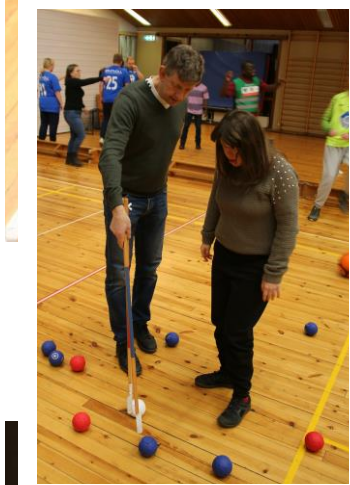
Møre og Romsdal idrettskrets i samarbeid med DNT Romsdal og Høgskolen i Molde arrangerte mandag 4. november paraidrettskveld i Molde. Besøkende fikk prøve ut ulike idretter og aktiviteter. Her er noen glimt fra kvelden.