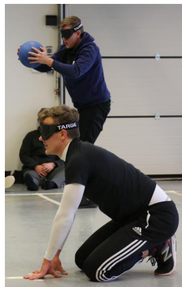
Bildet over: Konsentrasjon før kastet.