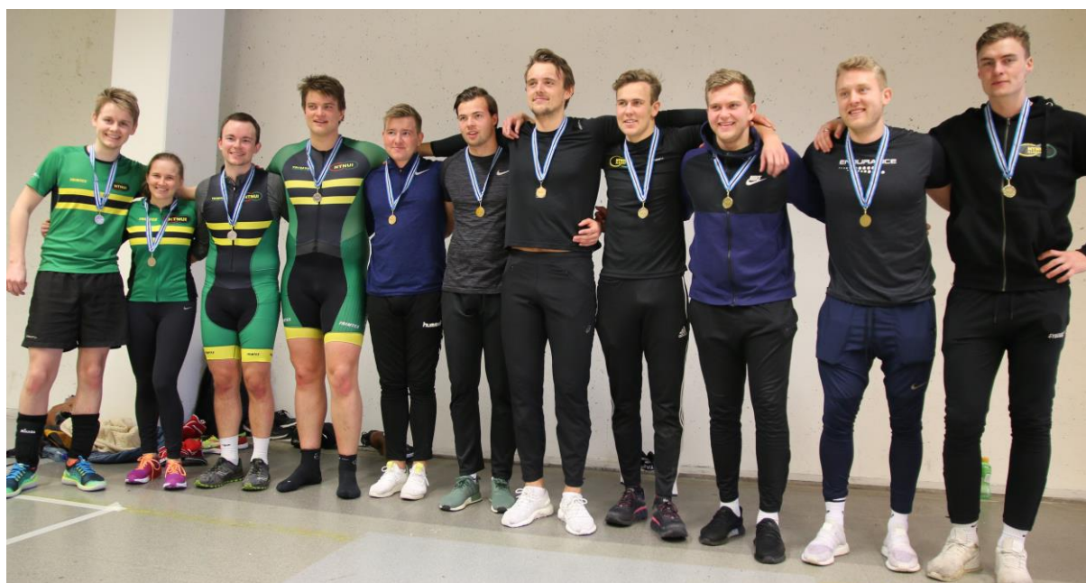
Bildet under f.v.: NTNUI Triatlon (sølv), Blindspot fra BISI Trondheim (gull) og Wonderboys fra Ålesund (bronse).